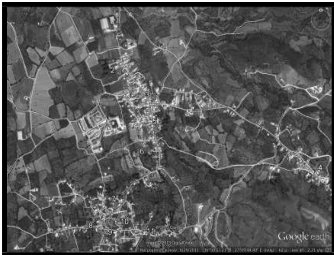
Εικόνα 4.5.1.: Ενδεικτικά σημεία τοποθέτησης μπλε κάδων στο Πυλί