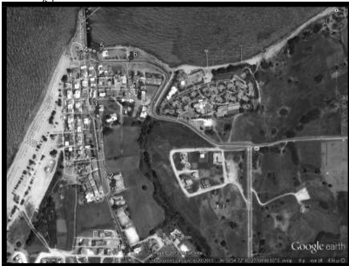
Εικόνα 4.4.1.: Ενδεικτικά σημεία τοποθέτησης μπλε κάδων στο Μαστιχάρι