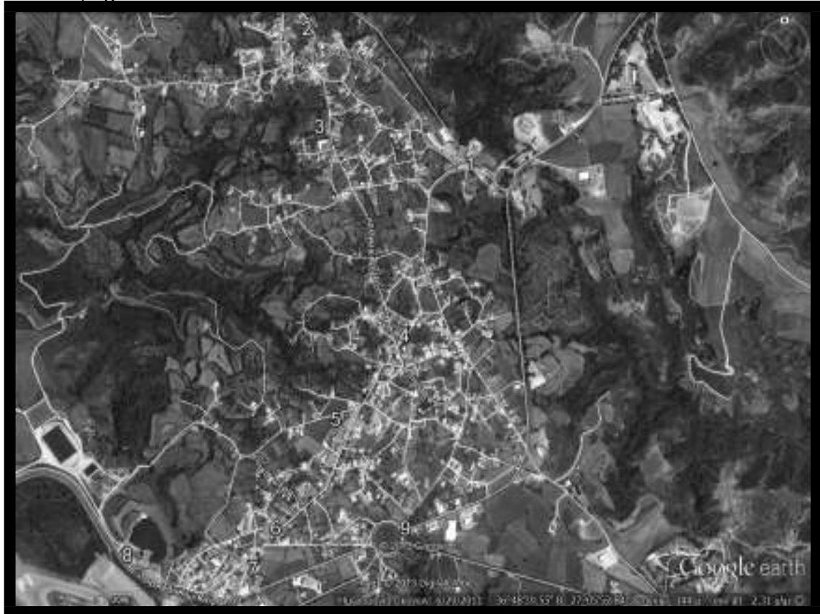
Εικόνα 4.3.1.: Ενδεικτικά σημεία τοποθέτησης μπλε κάδων στην Αντιμάχεια