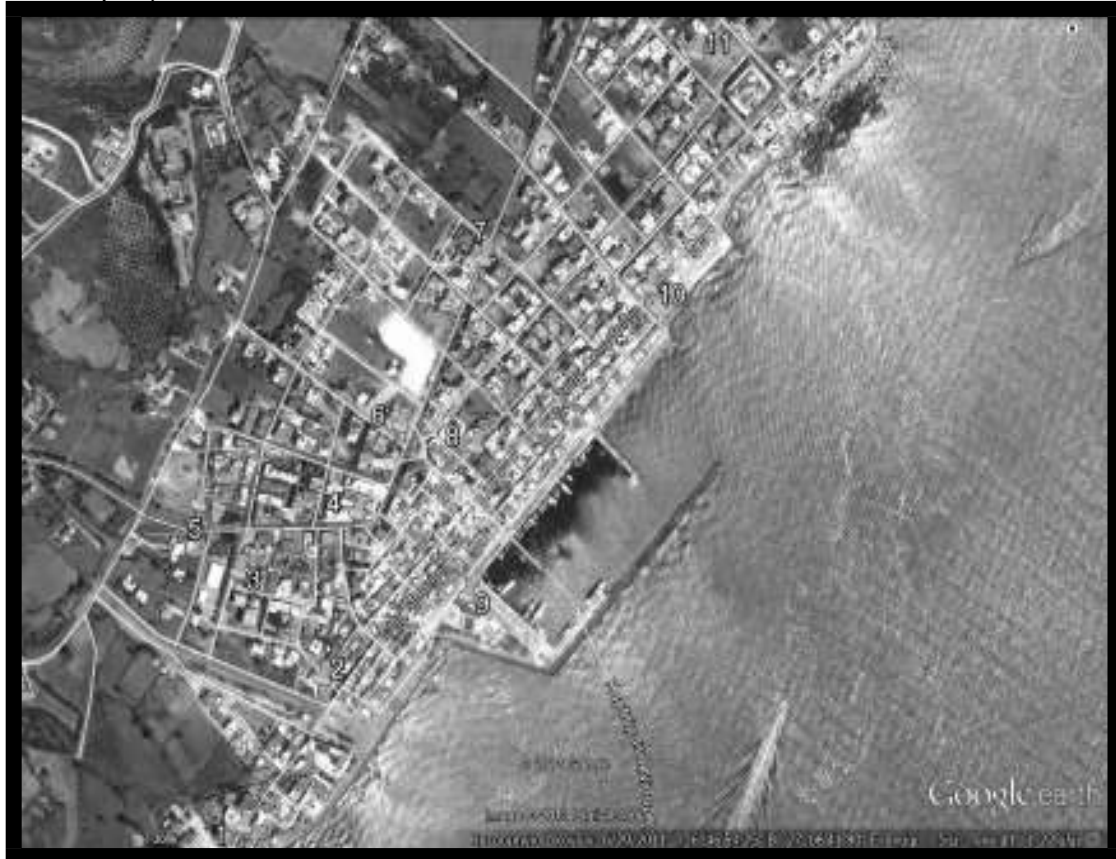
Εικόνα 4.2.1.: Ενδεικτικά σημεία τοποθέτησης μπλε κάδων στην Καρδάμαινα