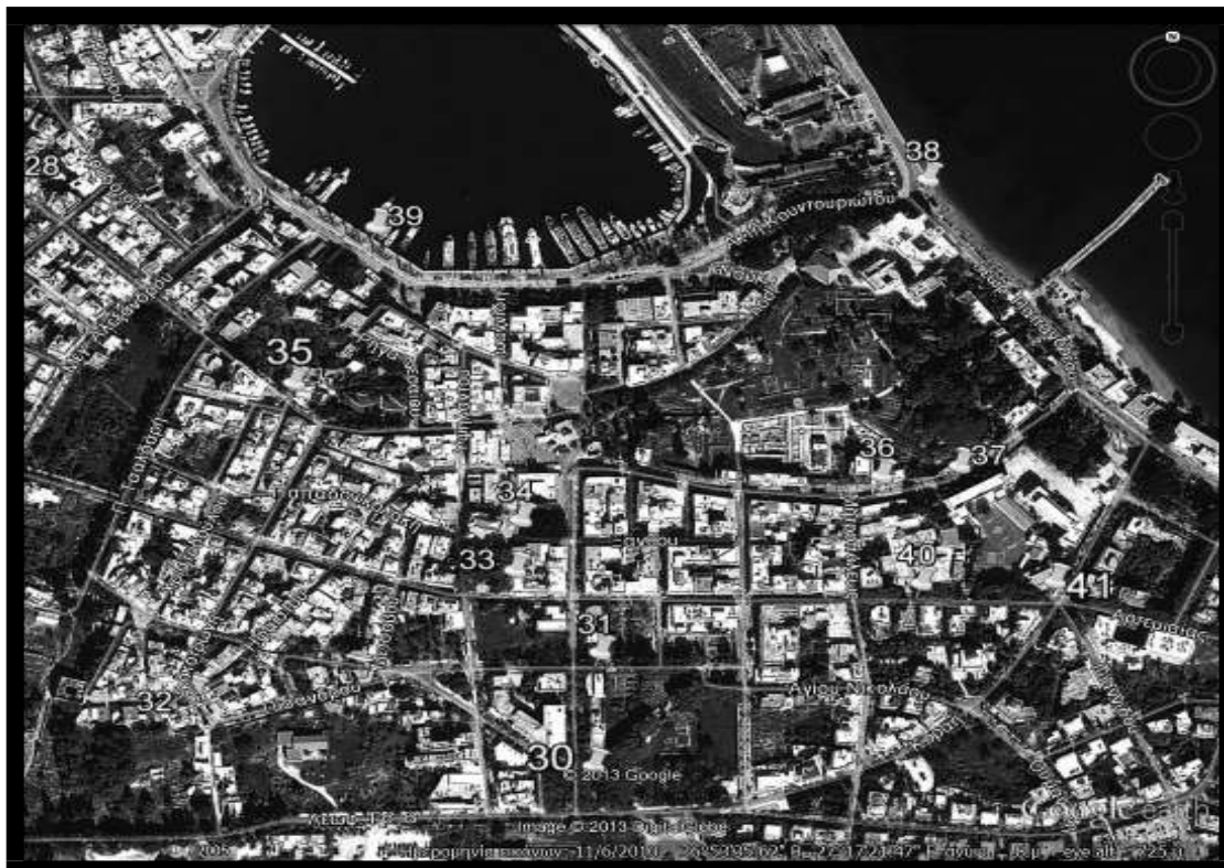
Εικόνα 4.1.3: Ενδεικτικά σημεία τοποθέτησης μπλε κάδων στην πόλη της Κω (Περιοχή: Κέντρο)