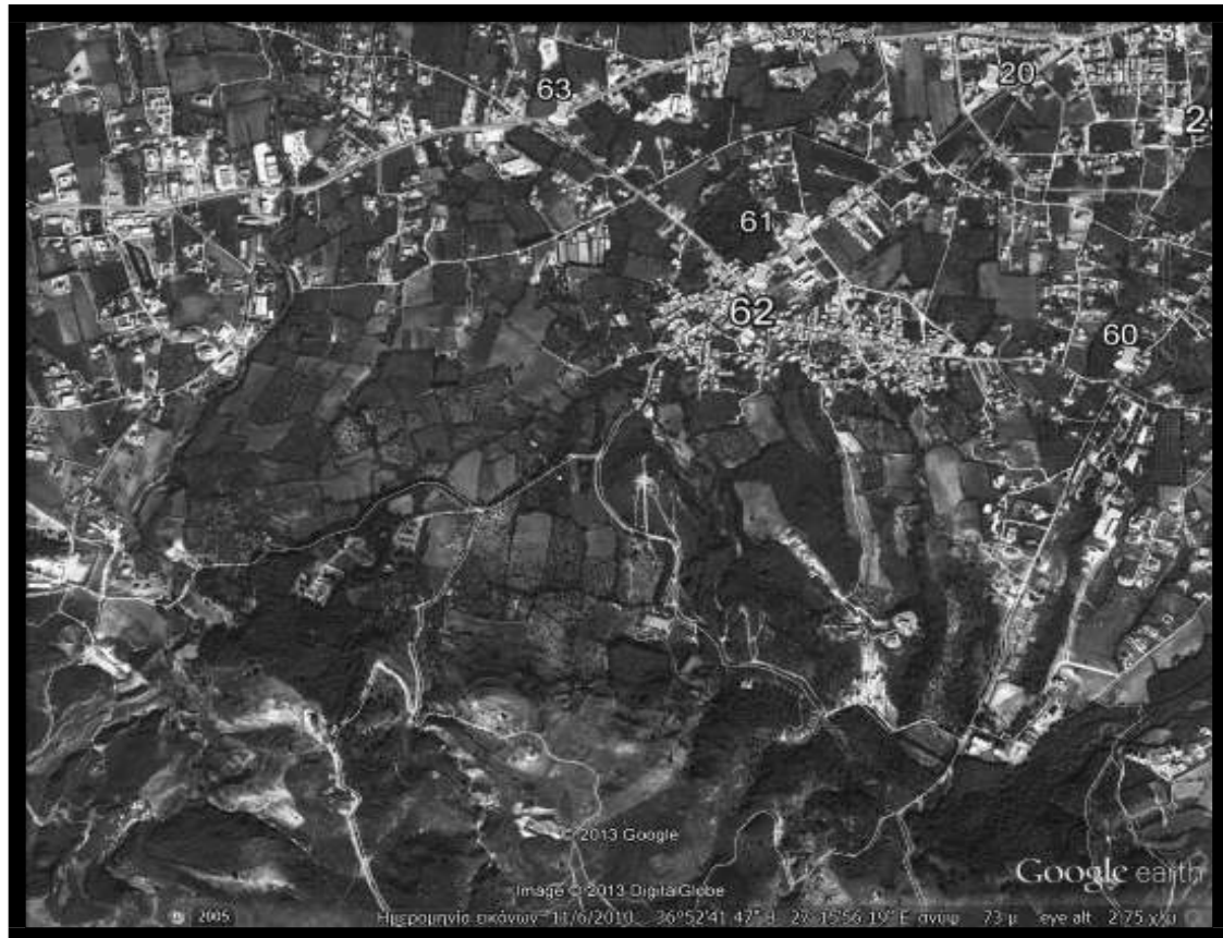
Εικόνα 4.1.6.: Ενδεικτικά σημεία τοποθέτησης μπλε κάδων στην πόλη της Κω (Περιοχή: Πλατάνι)