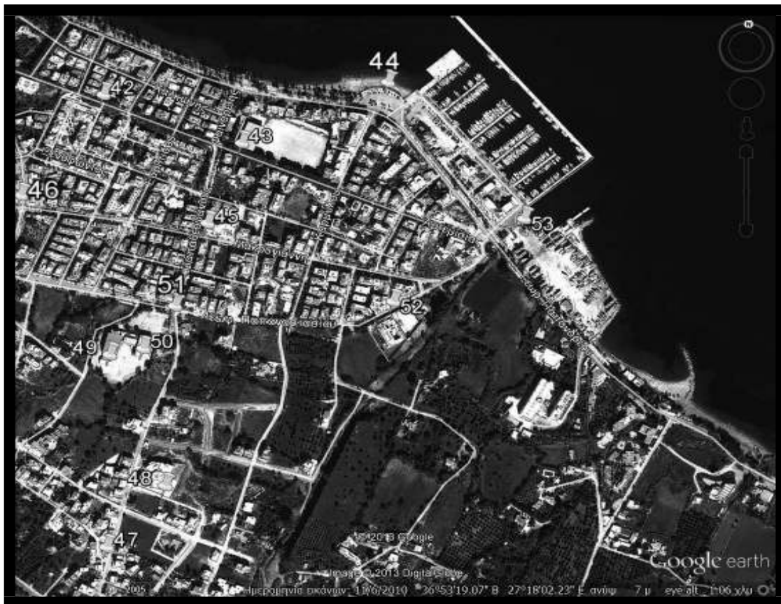
Εικόνα 4.1.4: Ενδεικτικά σημεία τοποθέτησης μπλε κάδων στην πόλη της Κω (Περιοχή: Αγία Μαρίνα)