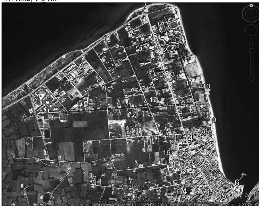
Εικόνα 4.1.1: Ενδεικτικά σημεία τοποθέτησης μπλε κάδων στην πόλη της Κω (Περιοχή: Λάμψη)