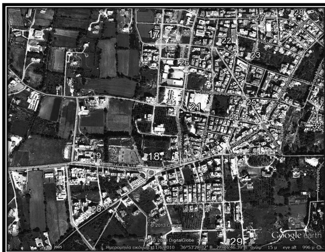
Εικόνα 4.1.2.: Ενδεικτικά σημεία τοποθέτησης μπλε κάδων στην πόλη της Κω (Περιοχή: Είσοδος της Πόλης)